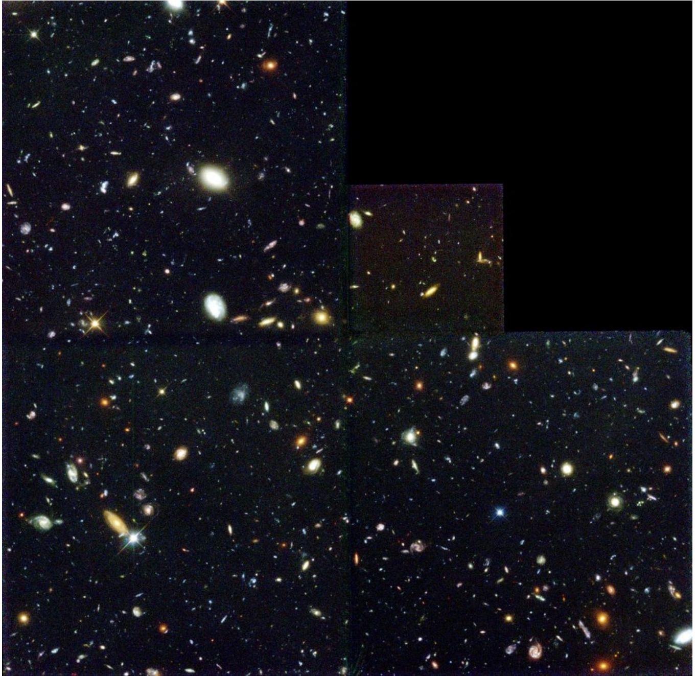
Hubble Deep Field

Guardare lontano significa guardare nel passato. Questa immagine ci mostra l'origine del nostro universo.